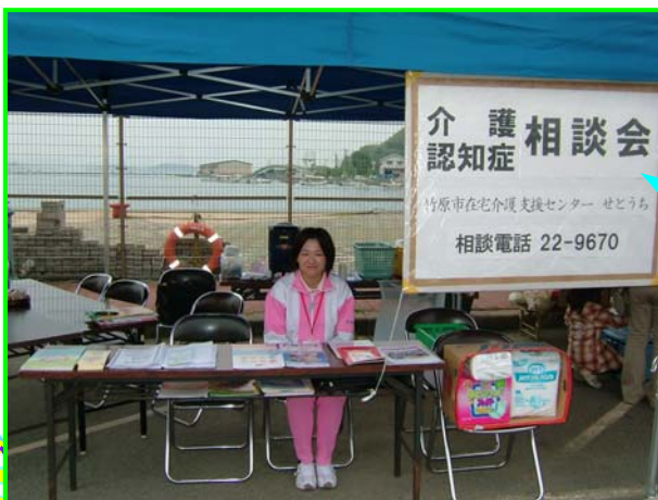
“みなとオアシスたけはら” での一コマ

在宅介護支援センターせとうちでは、竹原市の委託を受けて日頃から皆様の地域を、「実態把握」で訪問させて頂いております。皆様とのお話しが充分できるように、これからも地域に出向いてまいりますので、お困りの際には遠慮なく声を掛けて下さい。よろしくお願い致します。