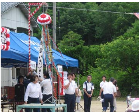
参加者の皆様による「くす玉割り」