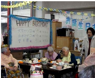
お誕生日おめでとう ございます