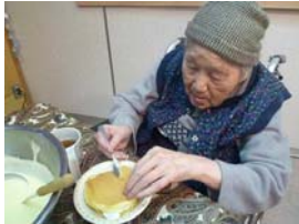
ホットケーキが 美味しく出来ました。