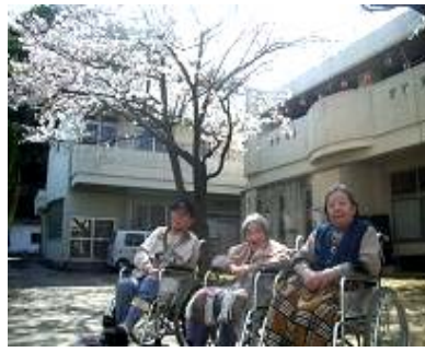
ぽかぽか陽気の中 お散歩しました