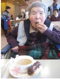
午後の優雅な コーヒータイム