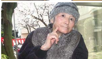
桜の下でハイ!! チーズ♪