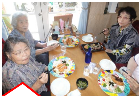
たまにはみんなで外食も楽しいね♪