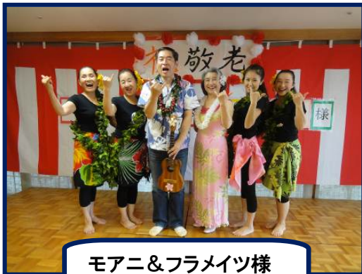
モアニ&フラメイツ様