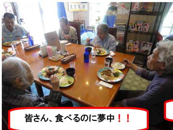
皆さん、食べるのに夢中!!

9月26日に「小さなレストランメゾン」にて外食行事。 トンカツランチやエビフライランチなど揚げ物を選ぶ方もいれば、サイコロステーキなどの鉄板物を選ぶ方もおられました。 皆様「おいしかった。また行きたい。」など好評のお声をいただいています。今後も外食を行う予定なので お楽しみに!