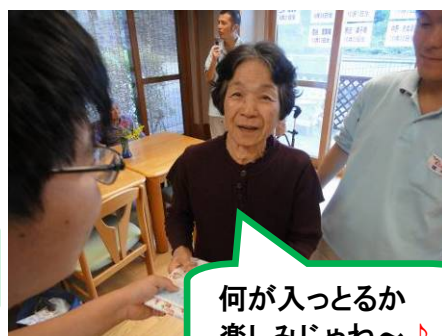
何が入るとるか楽しみじゃね〜♪