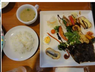
とっても美味しそう!!