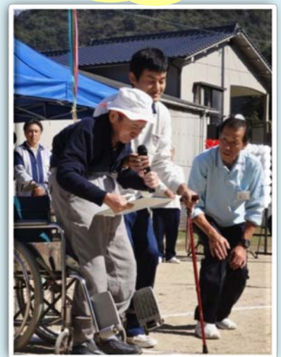
ご利用者様代表挨拶