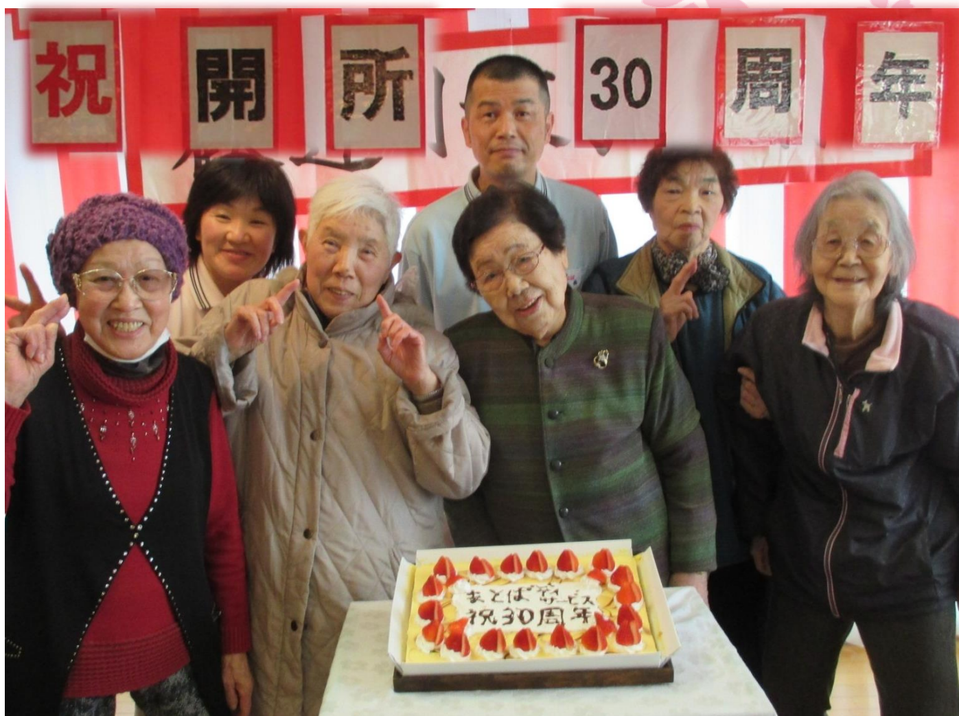
「通所介護事業所まとは」30周年開所記念行事でのケーキお披露目会

若葉の美しい季節となりました。皆様、お変わりなくお過ごしでしょうか。的場会では、通所介護事業所まとは・瀬戸内デイサービスセンターが30周年を迎えることができました。これもひとえに、皆様の暖かいご支援のおかげと、深く感謝しております。これからも、お客様・地域の皆様から必要とされる的場会であるよう、職員一同、努力してまいります。