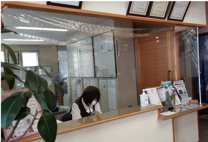
受付に飛沫感染予防の透明フィルムを設置