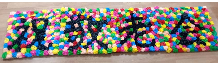
通所介護事業所 まとはば