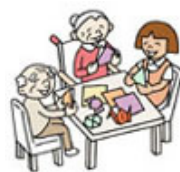
季節のカレンダー