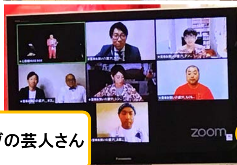
介護ブの芸人さん