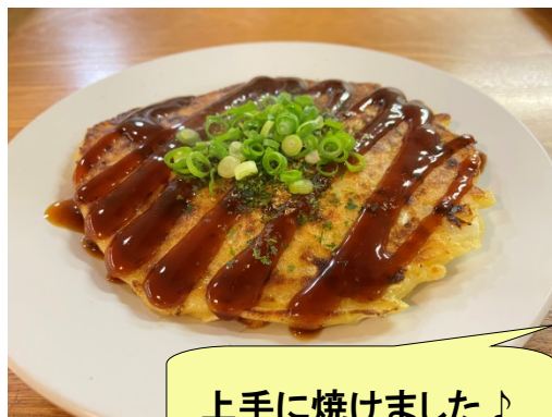
上手に焼けました♪

えびや豚肉など具材がたっぷり、ほとんどのお客様が おかわりをしてくださいました！